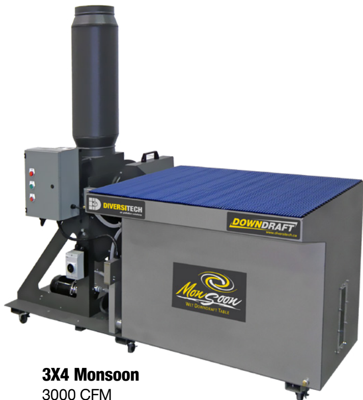
3X4 Monsoon 3000 CFM

La serie de productos de mesas aspirantes en húmedo MONSOON® ofrece la captura segura de polvos peligrosos/ combustibles con el equipo mas compacto en la industria. El diseño de esta mesa autónoma aspirante en húmedo de patente pendiente ofrece una muy alta fase de velocidad a un precio muy asequible. Una amplia gama de kits de aplicaciones y accesorios hechos a la medida pueden ayudarle a cumplir los requisitos de la NFPA y OSHA.